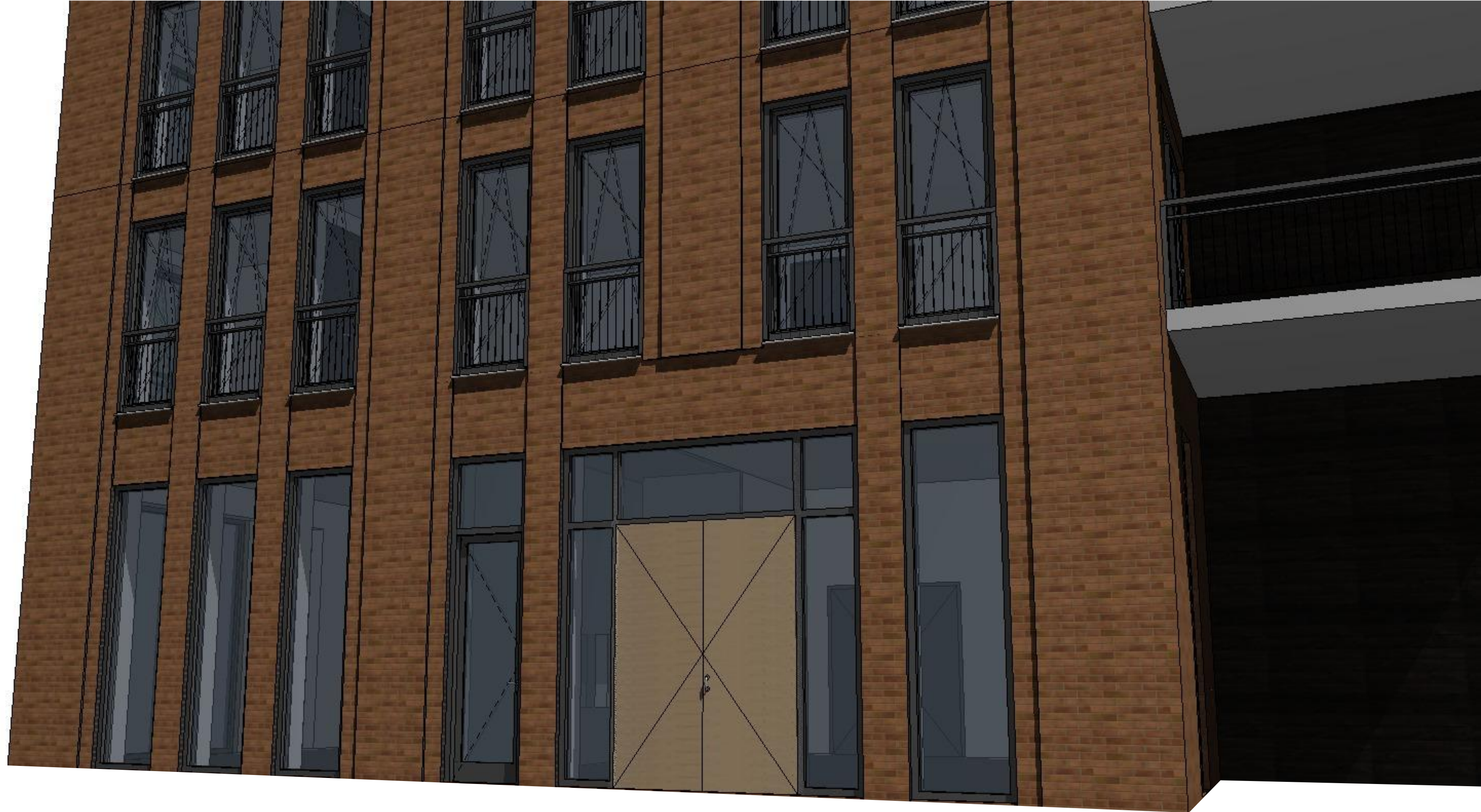
3D - Entree 02